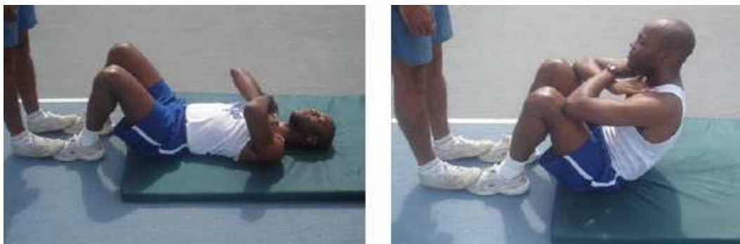
Figura 2 – Flexão de tronco sobre as coxas.

Será avaliada através da flexão do tronco sobre as coxas.