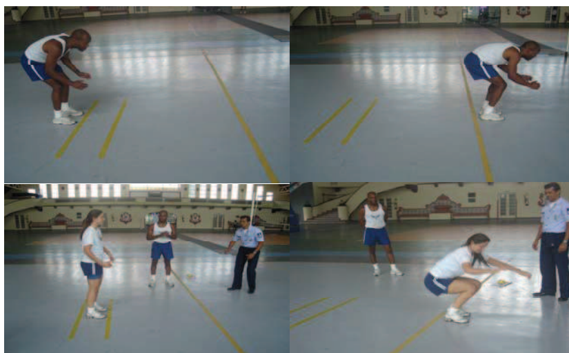
Figura 3 - Teste de salto horizontal

Obs.: Neste teste, serão exigidos os mesmos padrões de execução para ambos os sexos