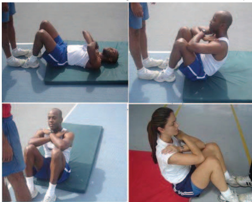
Figura 2 - Flexão do tronco sobre as coxas

Obs.: Neste teste, serão exigidos os mesmos padrões de execução para ambos os sexos.