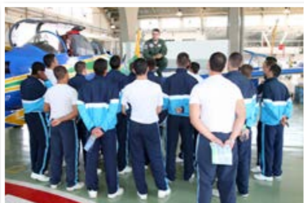
Visita da Escola Preparatória de Cadetes do Ar (EPCAR) - Barbacena/MG

Desde setembro passado, mais de 25 grupos conheceram o hangar da Fumaça. Diante da grande procura, a Esquadrilha incluiu os finais de semana na agenda de visitas como uma nova oportunidade. Entre os meses de outubro e novembro, mais de 180 pessoas conheceram a Esquadrilha em visitas aos sábados e domingos, nos horários das 9h às 12h e das 14h às 16h.