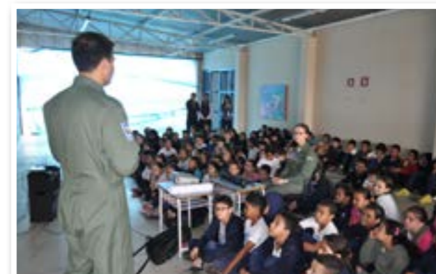
Palestra no Colégio Mão Amiga - Itapecirica da Serra/SP