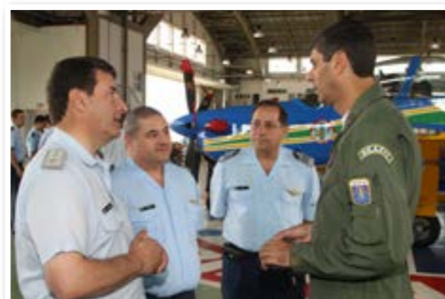
Visita da Força Aérea Argentina

A Esquadrilha incluiu os finais de semana como uma nova oportunidade de visita ao Esquadrão.