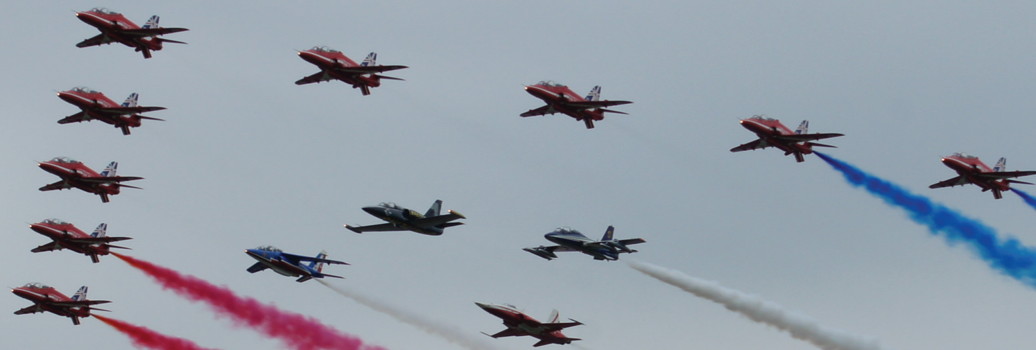
Red Arrows voa com líderes de esquadrilhas mundiais