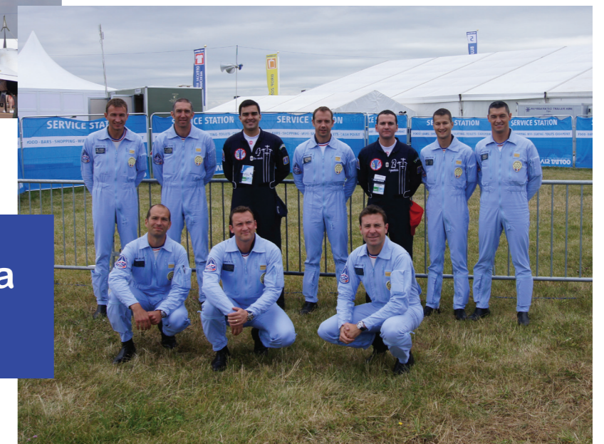
Pilotos com a equipe da Patrouille de France