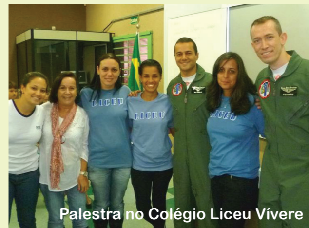
Palestra no Colégio Liceu Viveré