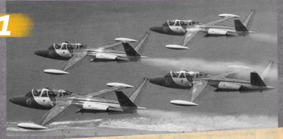
"Show" Comemorando o 19º aniversário de fundação da Esquadrilha da Fumaca, jovens pilotos da FAB, em modernos aviões "Fouga-Magister", deram autêntico "show" de pericia, arrôjo e precisão em espetaculares manobras acrobáticas, que tiveram como cenário a Baía de Guanabara. — (NA PAGINA SEIS)

Quando a Fumaca completou 19 anos, o grupo voou sobre o Rio de Janeiro com as aeronaves T-24 Fouga Magister. Na época, a sede da Esquadrilha se localizava no aeroporto Santos Dumont (RJ).