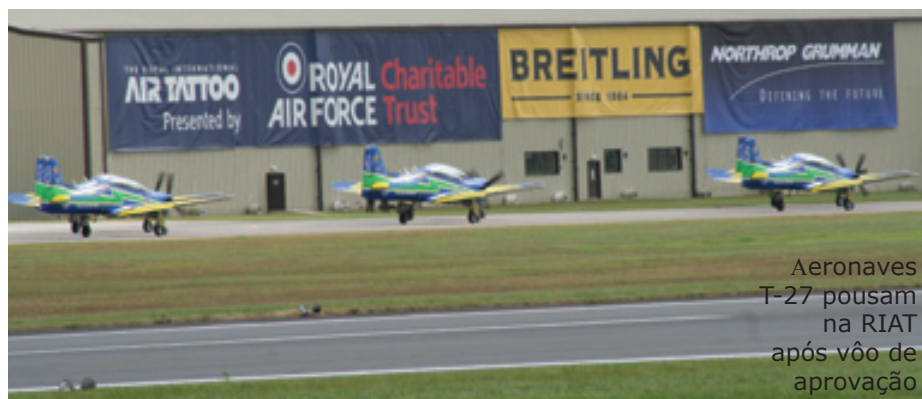
Aeronaves T-27 pousam na RIAT após vôo de aprovação