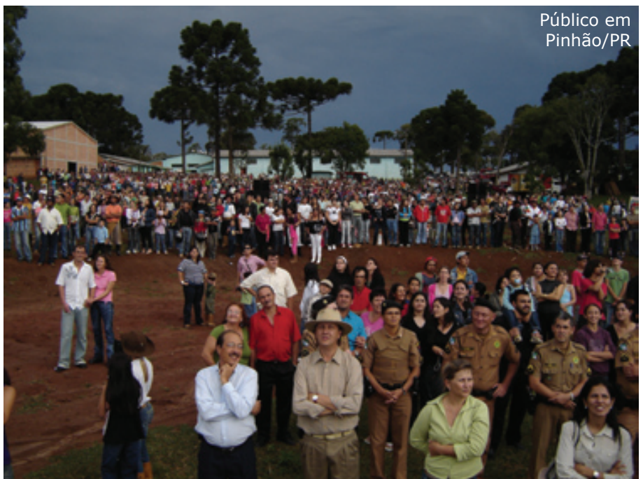
Público em Pinhão/PR