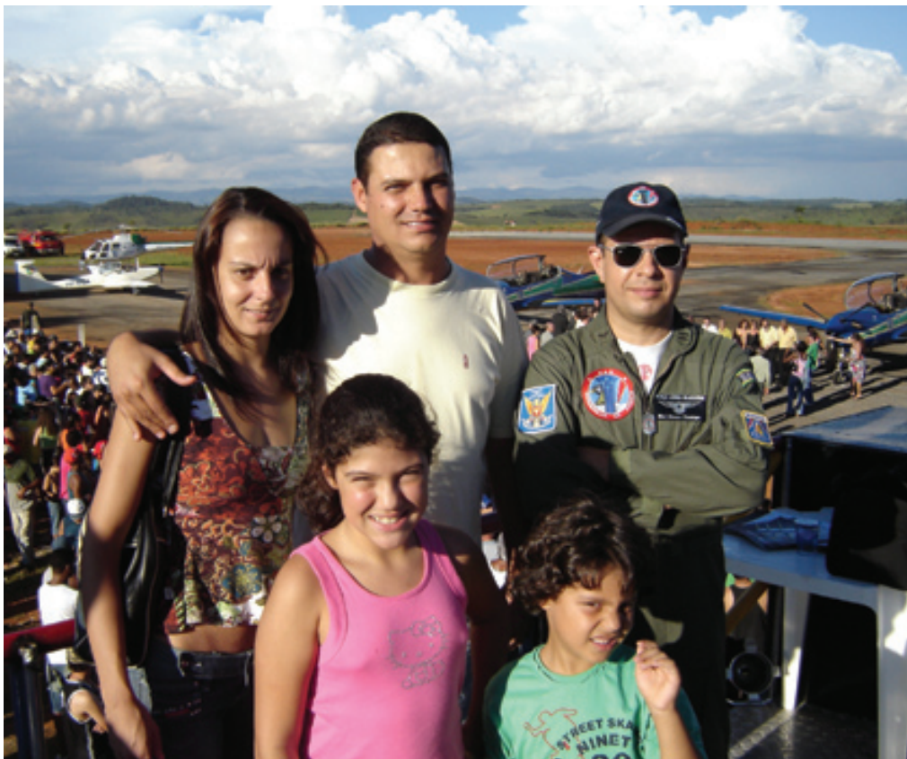
Família admiradora do EDA em demonstração de Conselheiro Lafaiete/MG

Honoráveis Senhores integrantes da Esquadilha da Fumaça, Hoje, vocês fizeram com que eu me lembrasse da Fumaça de minha infância, de meus sonhos de criança.