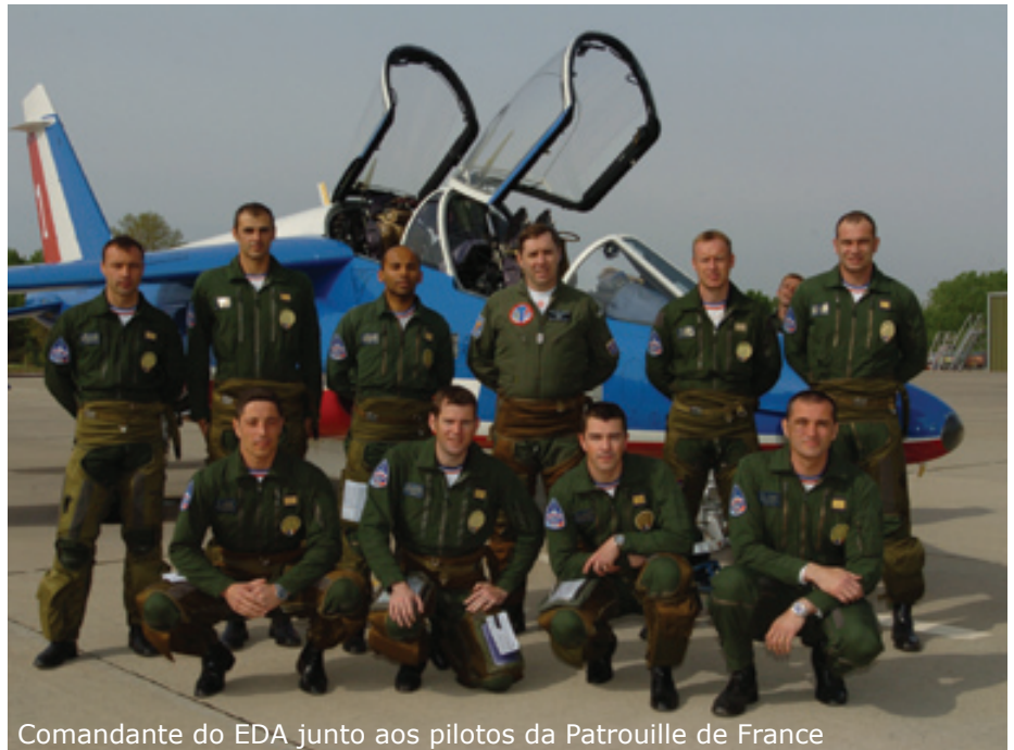
Comandante do EDA junto aos pilotos da Patrouille de France

A atividade de intercâmbio, que teve início no ano de 2006, tem se mostrado muito positiva, colaborando para a aproximação das instituições e troca de experiências operacionais.