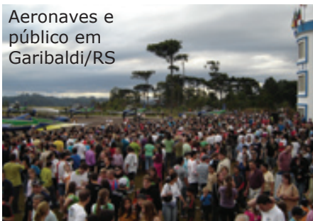
Aeronaves e público em Garibaldi/RS