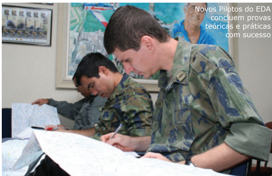
Novos Pilotos do EDA concluem provas teóricas e práticas com sucesso

Após a demonstração, os militares do EDA e seus familiares comemoraram a estréia dos pilotos e o Dia do Especialista em evento realizado no hangar da Esquadrilha.