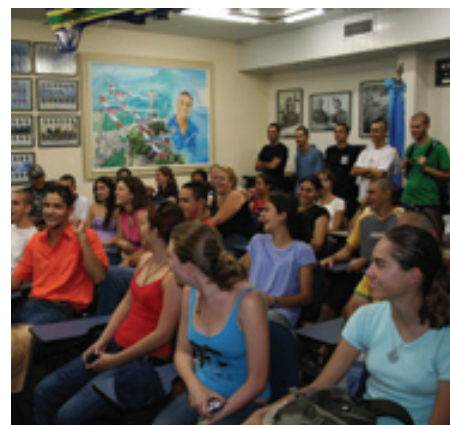
Universitários sanam suas dúvidas

Ao final da visita, todos receberam um folder informativo.