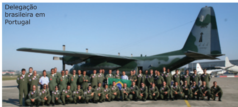
Delegação brasileira em Portugal

O Esquadrão de Demonstração Aérea mais uma vez representou o Brasil no exterior, justificando o título de “Embaixador do Brasil nos céus”. A “Royal International Air Tattoo (RIAT)”, maior feira de aviação militar do mundo, aconteceu na cidade de Fairford, na Inglaterra. A missão se estendeu pelo período de 02 a 21 de julho, com deslocamento de oito aeronaves T-27 Tucano, apoiadas por um C-130 Hércules, do 1º Esquadrão do 1º Grupo de Transporte.