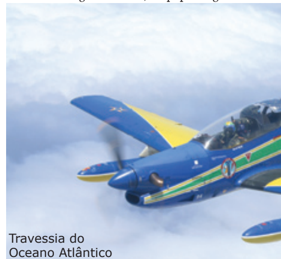
Travessia do Oceano Atlântico

Em 09 de julho, após aproximadamente 30 horas de vôo, sendo destas, 22 horas sobre o oceano, e sete dias de viagem, o Esquadrão de Demonstração Aérea chegou ao seu destino final, a cidade de Fairford, na Inglaterra. A viagem transcorreu de acordo com o planejamento previsto pelo EDA e, apesar das condições meteorológicas adversas em alguns trechos, a equipe chegou