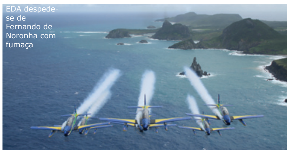
EDA despede-se de Fernando de Noronha com fumaça