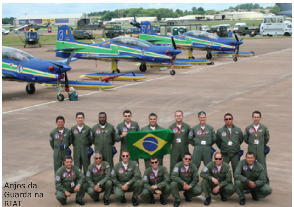
Anjos da Guarda na RIAT