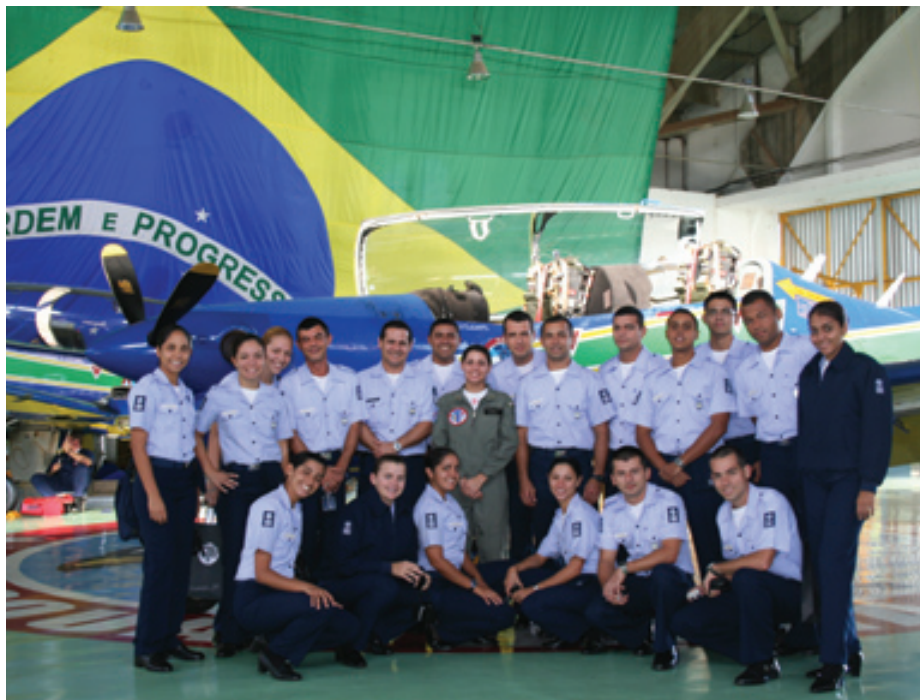
Estagiários da EEAR conhecem a aeronave T-27 de perto

No EDA, os estagiários assistiram ao vídeo institucional e conheceram a aeronave T-27.