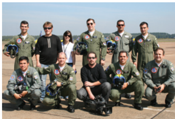
Equipe de produção do Programa Domingão do Faustão

No dia 16 de maio, uma equipe da produção do programa esteve presente na sede do Esquadrão, local onde foram feitas as filmagens. As imagens foram ao ar no dia 18 de maio, data em que o programa completou a expressiva marca.