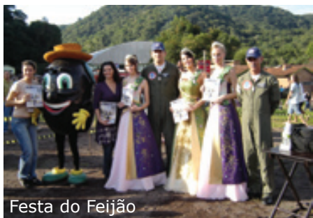
Festa do Feijão

Finalmente, no dia 14 de abril, os integrantes do EDA retornaram à sua sede com o sentimento de dever cumprido.