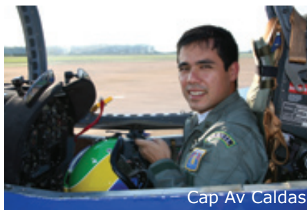
Cap Av Caldas