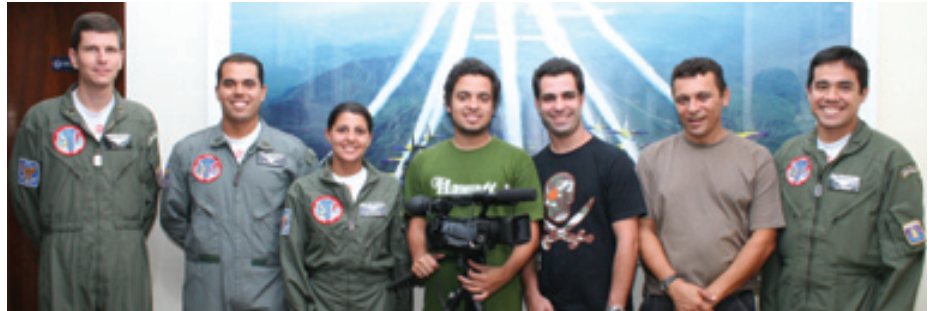
Equipe da TV Uniban junto a oficiais da Esquadrilha da Fumaça

Durante todo o dia, foram gravadas imagens dos vôos realizados e do trabalho de manutenção das aeronaves. Ainda