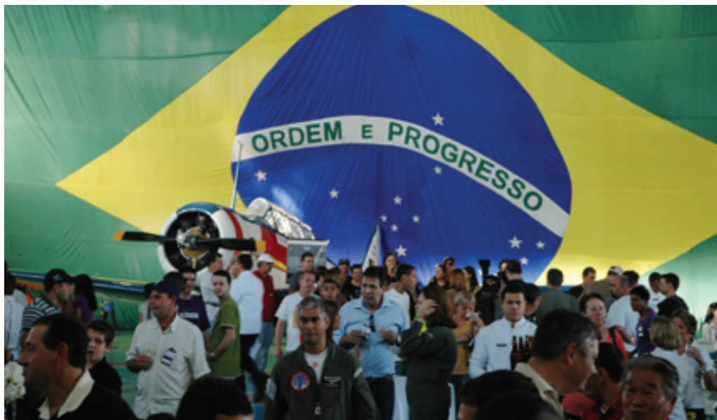
Convidados conhecem um pouco da história do T-6