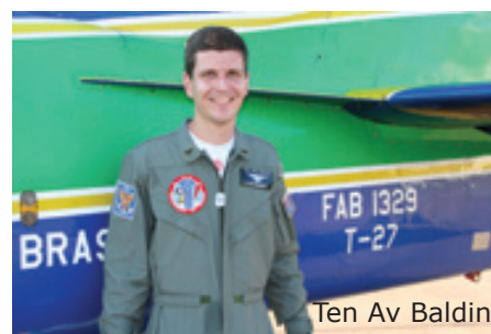
Ten Av Baldin