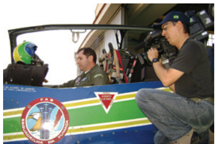
Comandante do EDA grava a oferta do lote de vôo acrobático

O leilão aconteceu no dia 27 de agosto, sendo sua divulgação oficial feita pelo Programa “O Melhor do Brasil”, da Rede Record. O comprador do lote terá três meses para desfrutar da aventura.