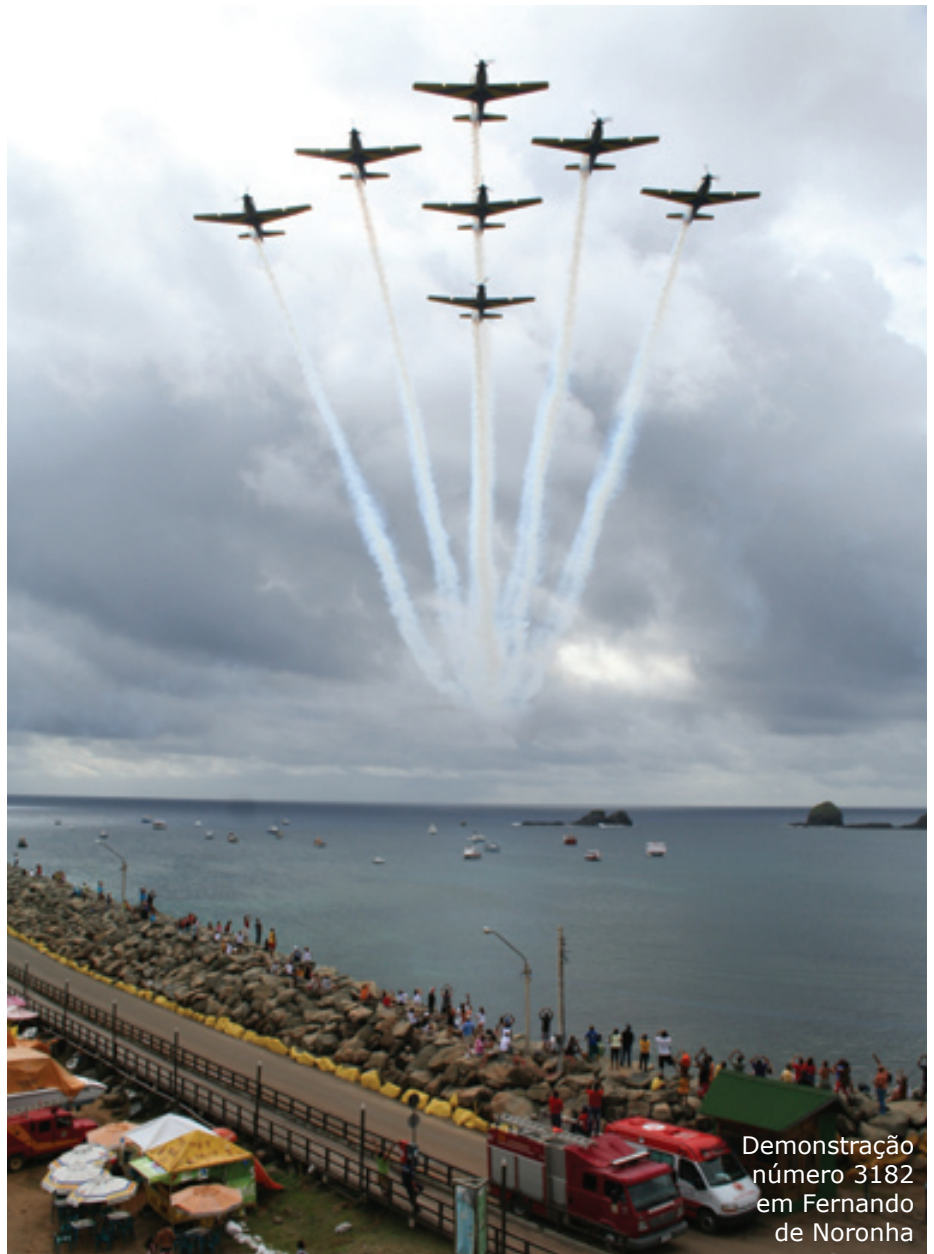
Demonstração número 3182 em Fernando de Noronha