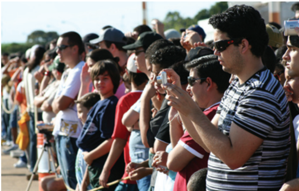
Mais de duas mil pessoas compareceram à demonstração

A Esquadrilha da Fumaça nasceu pela iniciativa de pilotos da antiga Escola de Aeronáutica, sediada no Campo dos Afonsos, Rio de Janeiro, que nos intervalos do almoço treinavam acrobacias em formação com a aeronave T-6. Foi criada oficialmente em 14 de maio de 1952, quando houve uma demonstração durante a visita de uma delegação de oficiais estrangeiros.