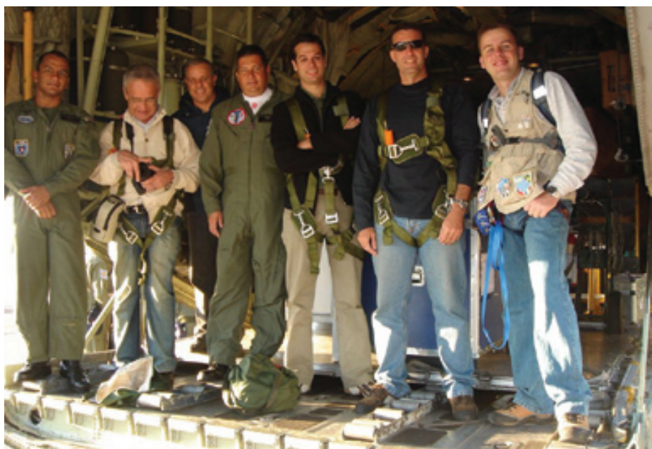
Integrantes da imprensa e militares preparam-se na rampa do C-130 Hércules

Durante o percurso, foi realizada a travessia da Cordilheira dos Andes e avistado o Pico do Aconcágua. Na ocasião, as oito aeronaves T-27 Tucano foram fotografadas e filmadas pela imprensa que acompanha a equipe e pelo fotógrafo do Esquadrão, a partir da aeronave de apoio C-130 Hércules. As imagens foram utilizadas para composição do acervo histórico da Esquadrilha da Fumaça, bem como para produção de materiais de divulgação.