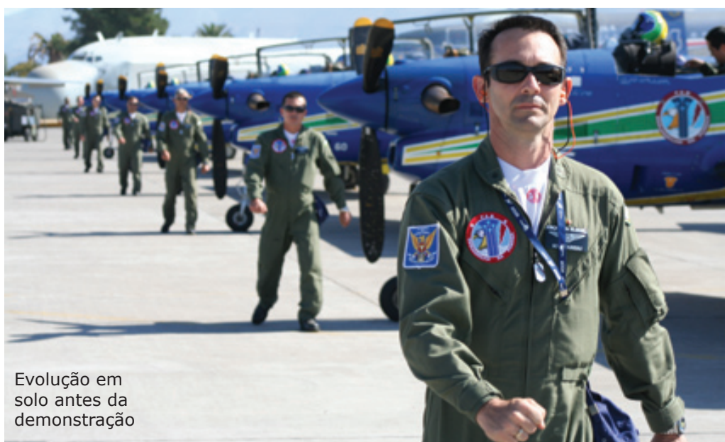
Evolução em solo antes da demonstração