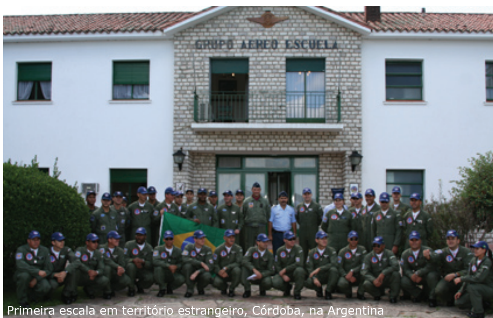
Primeira escala em território estrangeiro, Córdoba, na Argentina

o EDA pousou em Mendoza, ainda em terras argentinas, onde os integrantes da missão FIDAE pernoveram e se prepararam para cruzar a Cordilheira dos Andes no dia seguinte, com destino a Santiago, no