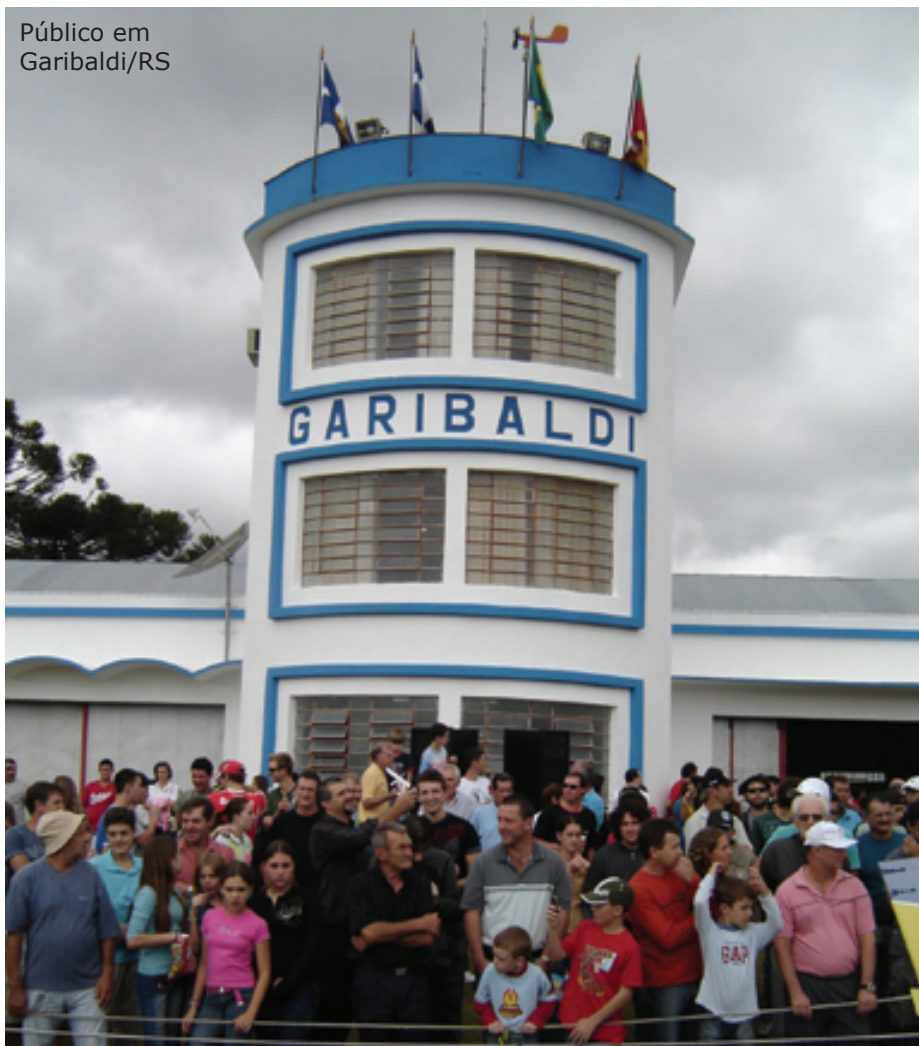
Público em Garibaldi/RS