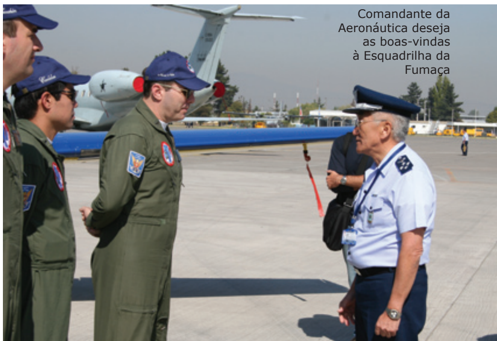
Comandante da Aeronáutica deseja as boas-vindas à Esquadrilha da Fumaça

As demonstrações da Esquadrilha da Fumaça e dos Halcones foram dois dos principais destaques da FIDAE, pois eram os únicos times de demonstrações aéreas participantes.