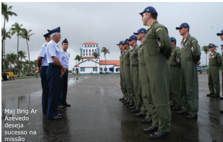
Maj Brig Ar Azevedo deseja sucesso na missão