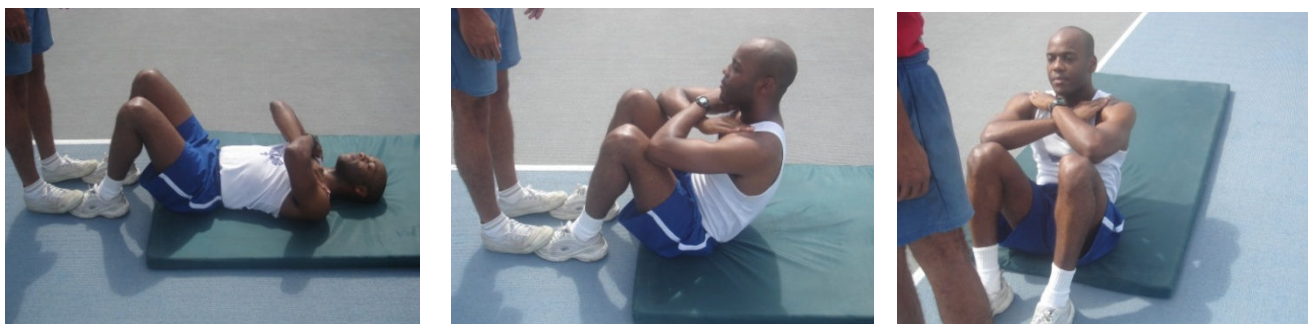
Figura 3 – Flexão de tronco sobre as coxas

Será avaliada através da flexão do tronco sobre as coxas.