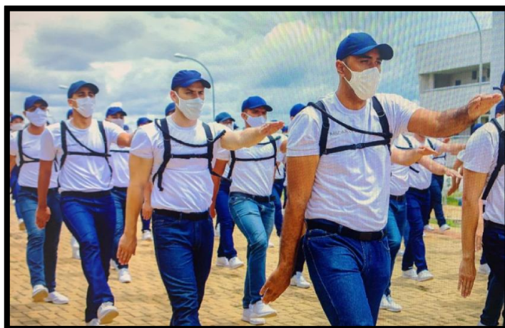
Figura 4 – Padrão do uniforme descrito em 3.2.