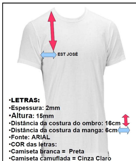
Figura 2 - Instruções para estampa da camiseta olímpica