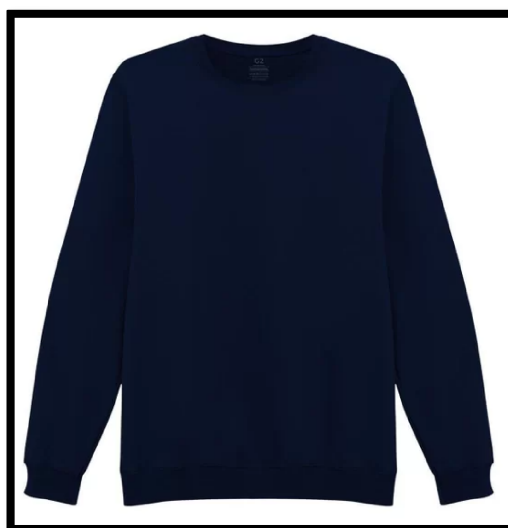
Figura 3 – Blusão moletom azul marinho de manga longa