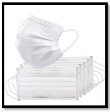
Figura 1 – Modelo preferencial de máscara

Cumprindo ainda informar que, devido a medidas preventivas estabelecidas em cumprimento às legislações em vigor acerca da prevenção ao COVID-19, é obrigatório o uso de máscara branca (preferencialmente conforme o modelo da Figura 1) durante eventos em ambientes cobertos no CIAAR (as máscaras brancas não serão distribuídas pelo CIAAR, devendo o próprio aluno providenciá-las previamente).