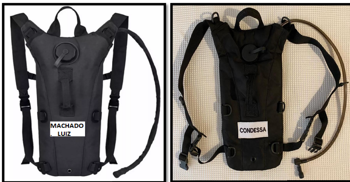
Figura 5 – Padrão da mochila de hidratação.