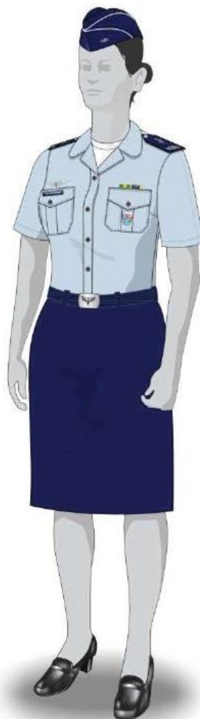
Imagem meramente ilustrativa. O uniforme deverá ser utilizado com calça pela aluna.

Atenção: na composição do 7º C da aluna devem ser utilizadas apenas as insígnias/distintivos, a tarjeta e o DOM do CIAAR.