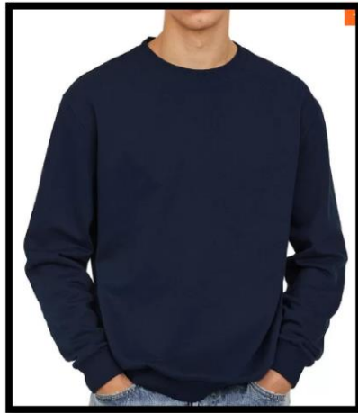
Figura 3– casaco tipo moletom azul-marinho sem capuz