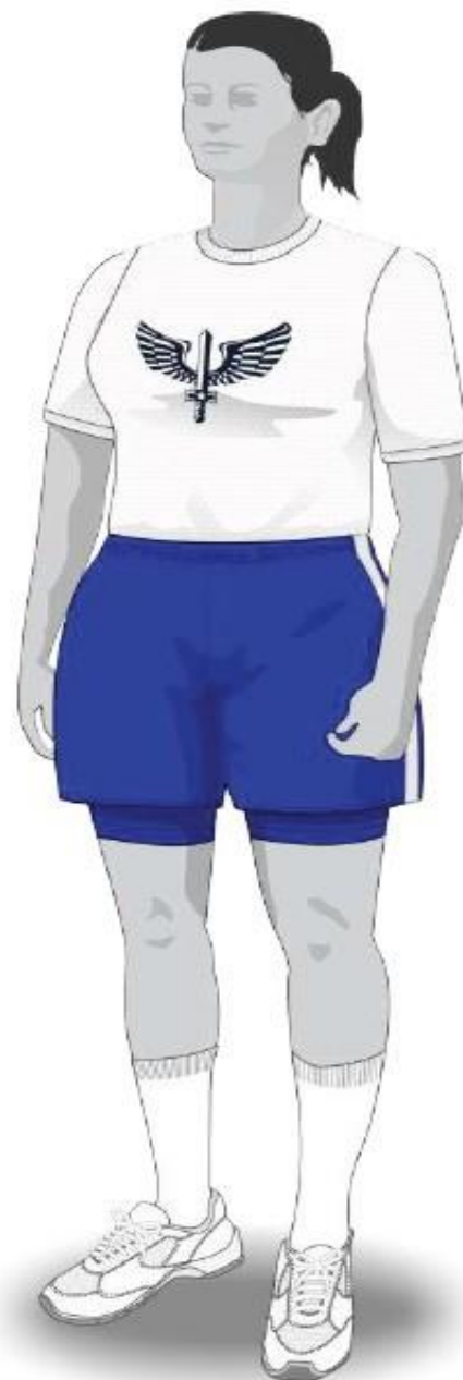
Com camiseta branca

Informamos que o padrão para o uso da meia no 9º uniforme no CIAAR configura-se com o topo da meia coincidindo com o primeiro terço da tíbia (canela) do militar.