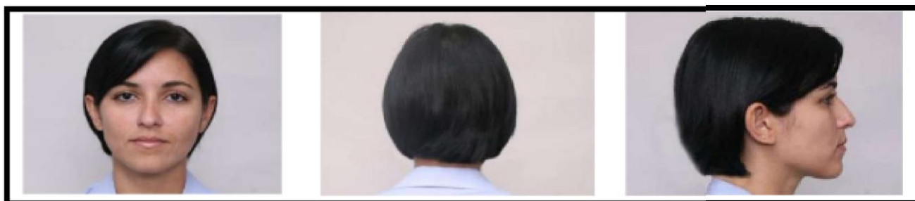
Figura2-Tamanho de cabelo padrão para a dispensa do coque