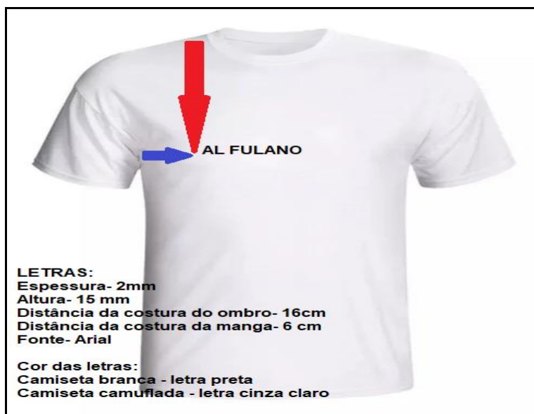
Figura 1-Instruções para estampa da camiseta olímpica

g) O(a) aluno(a) que já é militar, deverá se apresentar no CIAAR de 7ªA–RUMAER (ou correspondente) nos eventos anteriores ao dia 15 de janeiro de 2024.