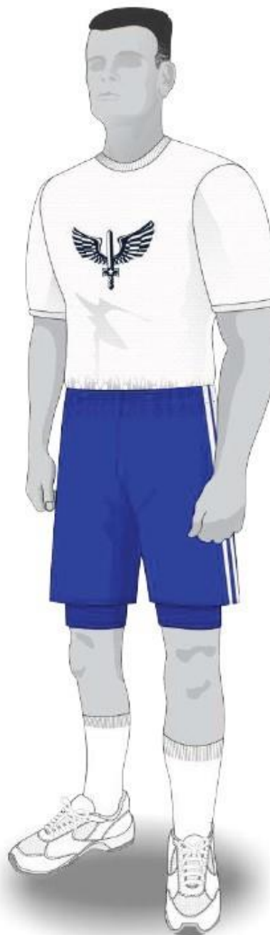
Com camiseta branca

Informamos que o padrão para o uso da meia no 9º uniforme no CIAAR configura-se com o topo da meia coincidindo com o primeiro terço da tíbia (canela) do militar.